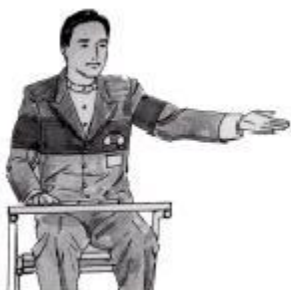
prvý podávajúci v sete, víťaz setu, zmena podania