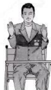
(strana stola) ZRUŠENÉ